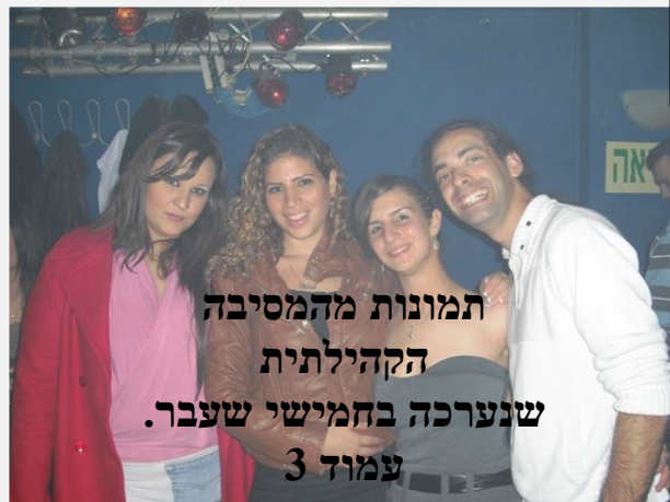
תמונות מהמסיבה הקהילתית שנערכה בחמישי שעבר. עמוד 3

ספר מלחמות ה' לרב רבנו סלמון בן ירוחם עמוד 5